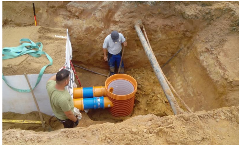
Mulden mit darunter liegenden Rigolen